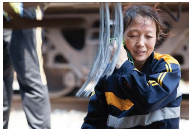
一位女货检员擦拭汗水。