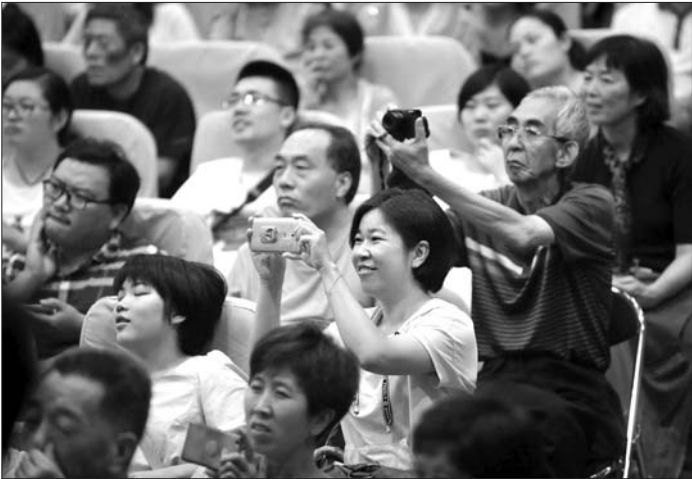
许多听众拍照或全程录下讲座回家慢慢赏析或留念。