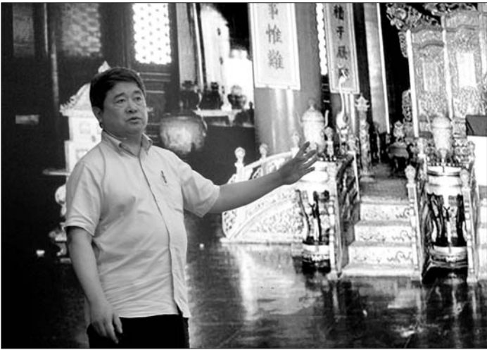
单霁翔院长介绍故宫各大殿内设置照明改善参观效果

29日下午,单霁翔做客第142期“齐鲁大讲坛”,用600多张图片讲述了故宫博物院的表情。