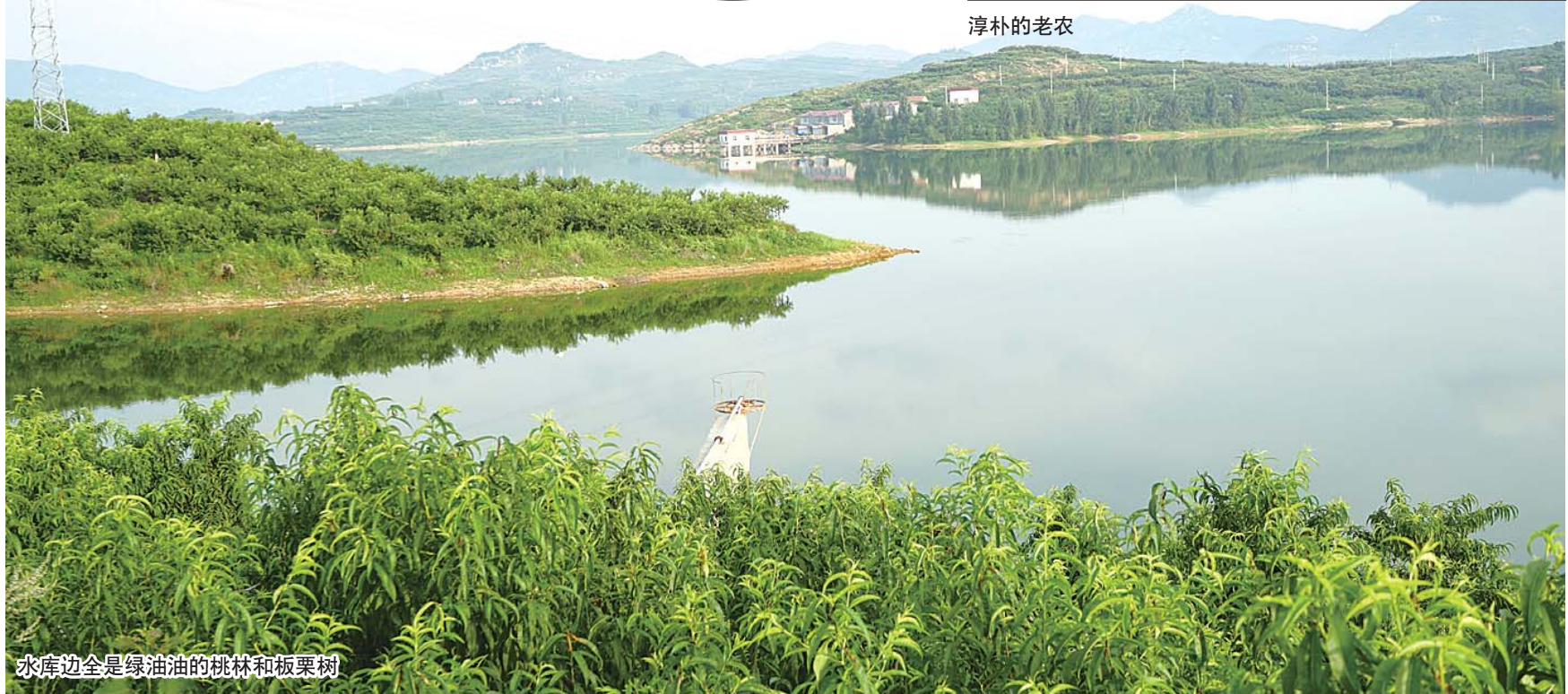
水库边全是绿油油的桃林和板栗树