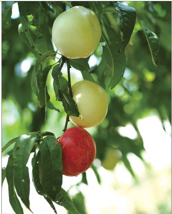
经过太阳照射和没有经过太阳照射的桃子