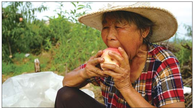
奶奶随手摘一个桃子吃起来