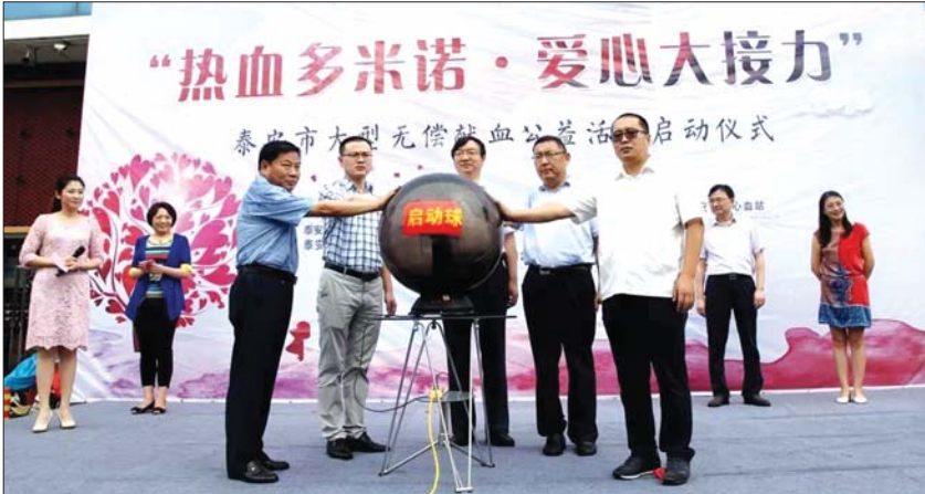
“热血多米诺·爱心大接力”公益活动开启。

仪式上,泰安中百大厦向泰安市第二家爱心献血企业——中国银行泰安市分行的负责人交接“热血多米诺·爱心大接力”公益旗帜。“当一张多米诺骨