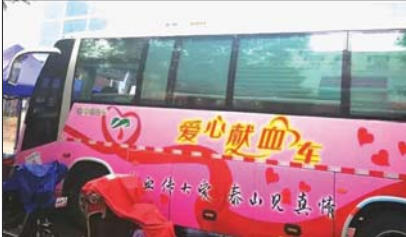
齐鲁晚报号公益爱心献血车。