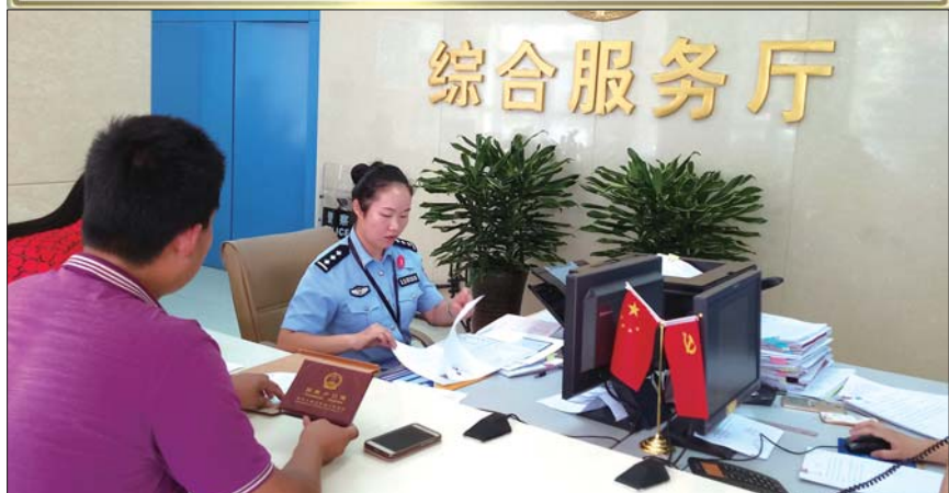
济南历城公安分局户政民警正在为居民办理户籍业务。