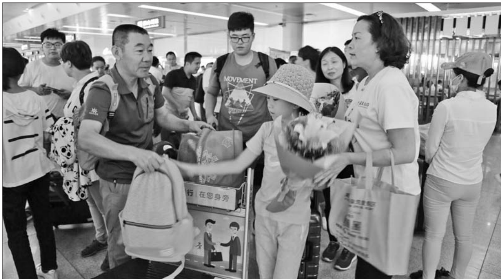
8月10日下午,8名游客从九寨沟返回济南。