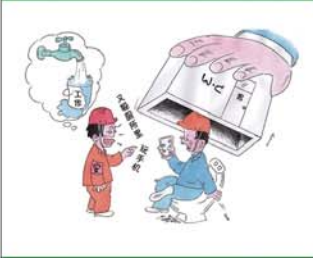
望闻问切安全薄弱人物排查处理法 三十一类安全薄弱人画像之二十