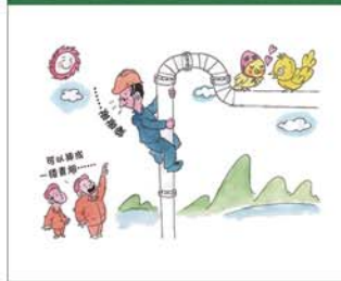
望闻问切安全薄弱人物排查处理法 三十一类安全薄弱人画像之二十三