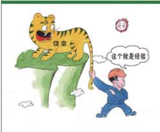
望闻问切安全薄弱人物排查处理法 三十一类安全薄弱人画像之三十