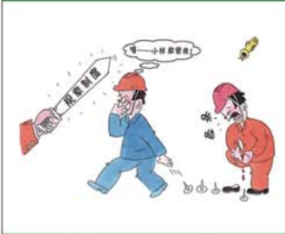
望闻问切安全薄弱人物排查处理法 三十一类安全薄弱人画像之十九