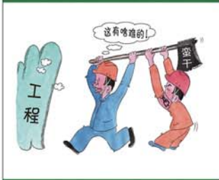
望闻问切安全薄弱人物排查处理法 三十一类安全薄弱人画像之十八