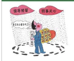
望闻问切安全薄弱人物排查处理法 三十一类安全薄弱人画像之二十七