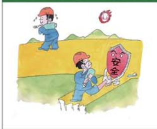
望闻问切安全薄弱人物排查处理法 三十一类安全薄弱人画像之二十二