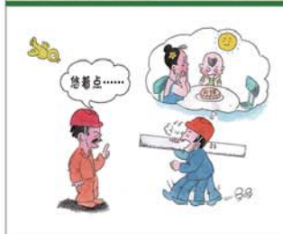
望闻问切安全薄弱人物排查处理法 三十一类安全薄弱人画像之三十一