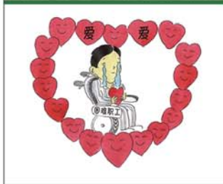
望闻问切安全薄弱人物排查处理法 三十一类安全薄弱人画像之二十四