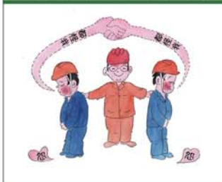
望闻问切安全薄弱人物排查处理法 三十一类安全薄弱人画像之二十六