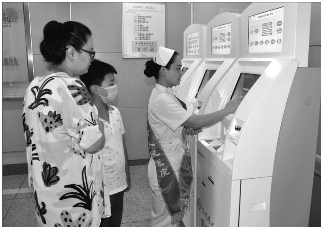
护士正在教市民使用自助机。

本报邹城8月10日讯(通讯员 陈伟) 一提起去医院看病,最让人头疼的就是排队,邹城市人民医院日前启用“银医通”自助系统,优化门诊就医流程。