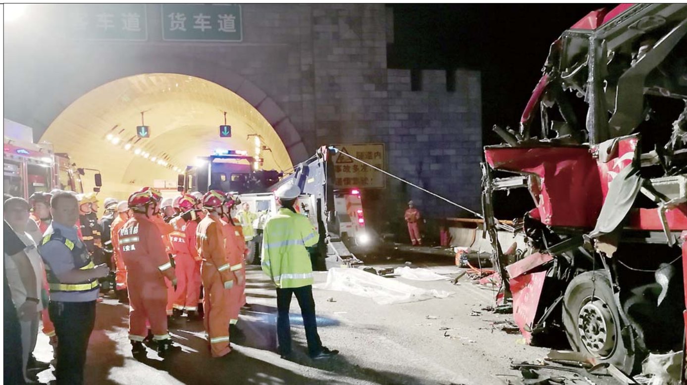
8月11日,救援人员在事故现场展开救援。 据新华社

京昆高速公路陕西段秦岭1号隧道发生一起大客车碰撞隧道口事故,13名伤者被及时送往医院进行治疗。12名伤者分别被送往西安森工医院、西安济仁医院、西安医专附属医院