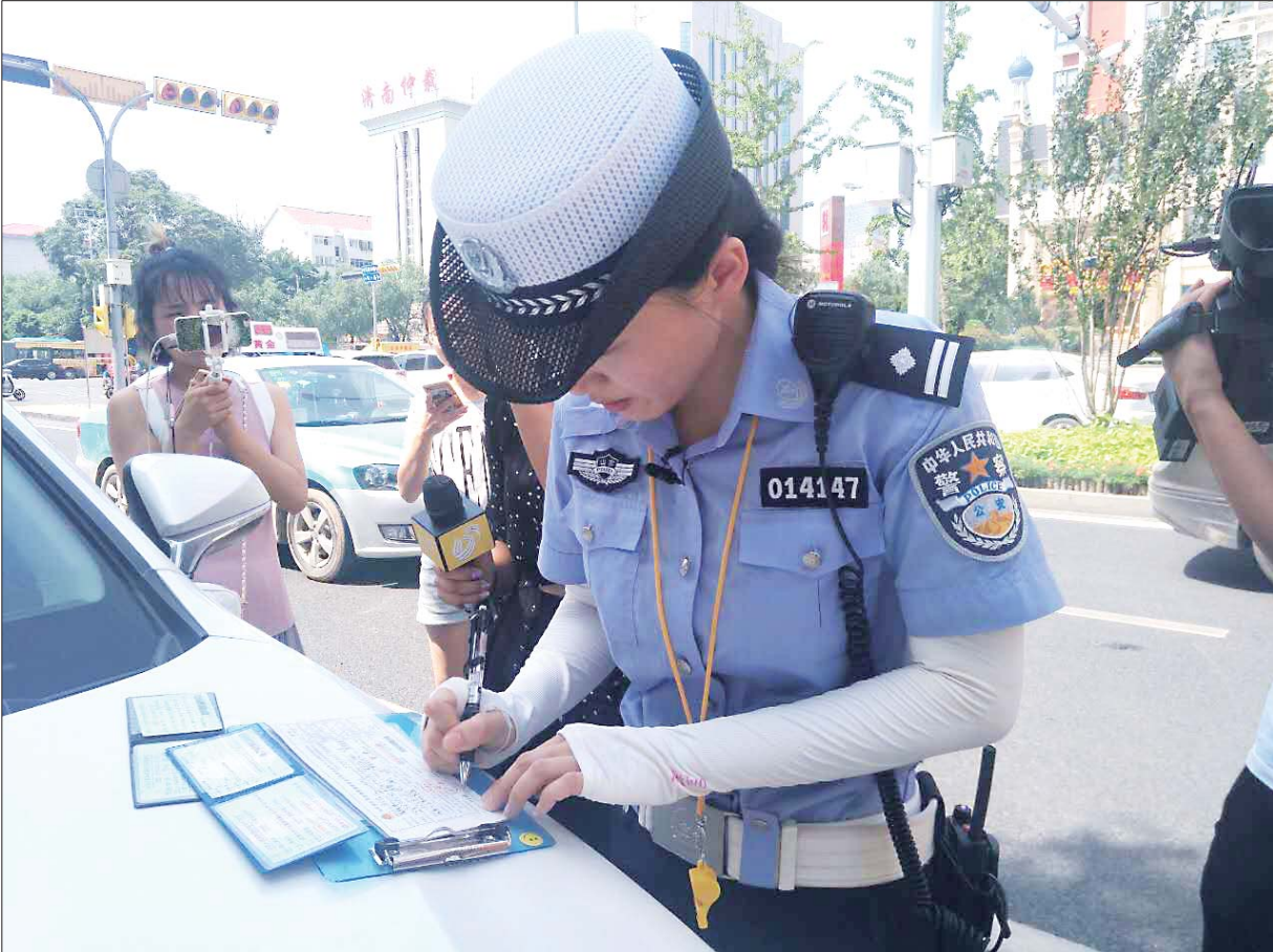
市中交警大队女子中队民警对连续变道违法行为进行查处。