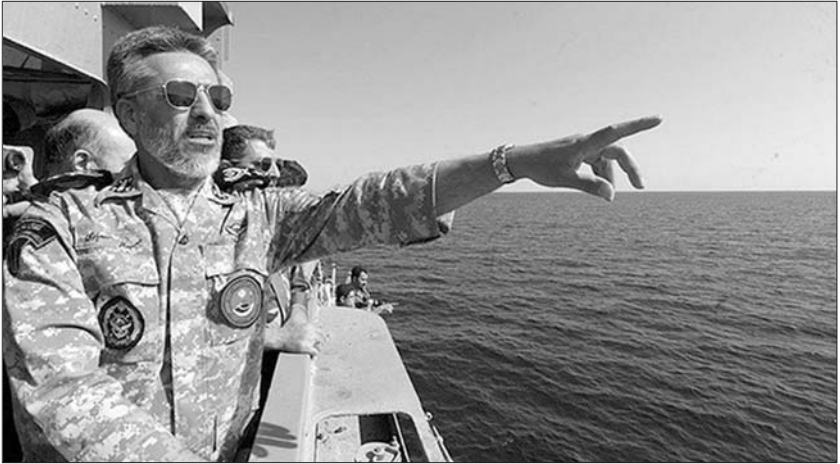
伊朗海军司令萨亚里

本月初美国总统特朗普对伊朗实施新制裁后,伊朗议会13日通过一揽子反制美国制裁的法案。当天,伊朗海军司令萨亚里还宣称,伊朗海军不久的将来将向西大西洋地区派遣军舰。