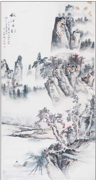
▲柳子谷 秋江垂釣 244cm×123cm

8月27日下午2点,山东蚨第雅2017季夏(8月)拍卖会将在青末了画廊(山东大厦大堂)举槌。蚨第雅拍卖团队以“精鉴慎擷、播美资藏”的理念,经过数月匠心甄选,将倾情呈现近现代、当代书画以及瓷杂文玩两个专场200余件精品,为各位收藏家和投资爱好者奉献一场精致的艺术品鉴赏盛宴。