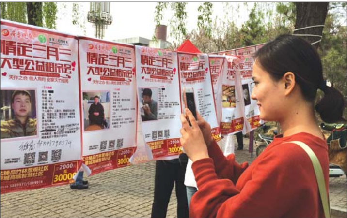
三月三相亲会现场。（资料片）