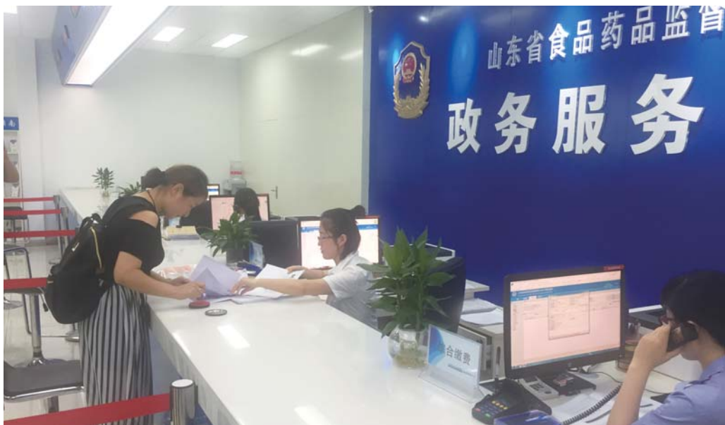
全程网办之后,企业最多跑一次就可以拿证。

“调整内设机构集中许可职能,让群众办事更方便,让监管工作更有力;‘全程网办’,让企业少跑腿早拿证;许可通道‘一变三’审批流程‘串改并’,让创新项目和重点升级改造项目不再被程序‘绊腿’。”说起省食品药品监督管理局正在搞的食品药品许可职能集中和流程再造工作,局长马越男思虑缜密。