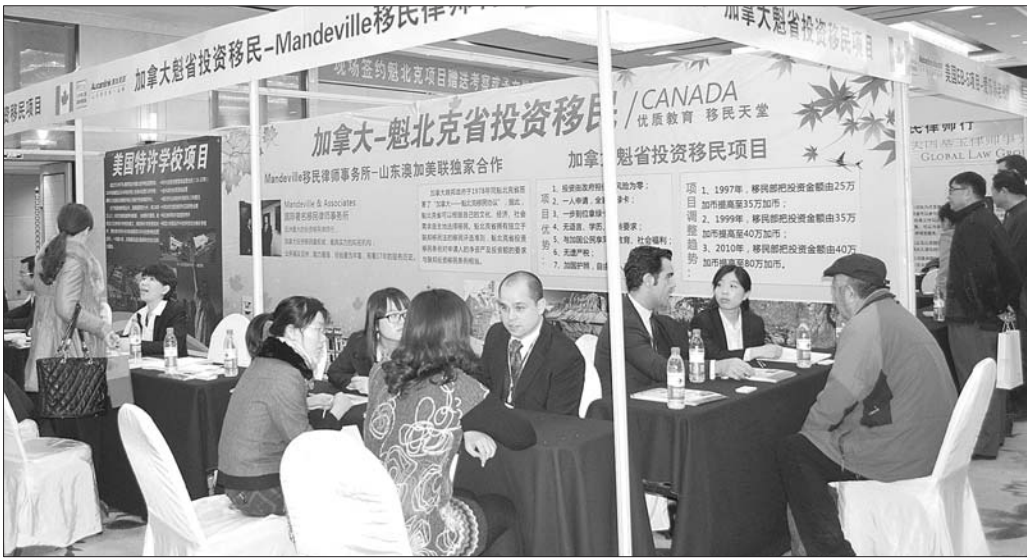
近年来,不少家长选择让孩子出国留学,出国留学咨询火爆。(资料片)