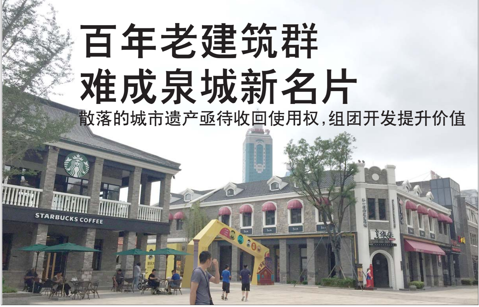
一处定位商业综合体的仿古建筑吸引不少游客前来参观。