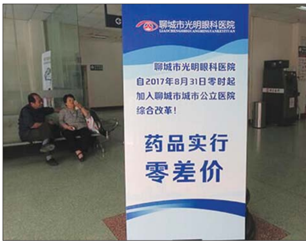
聊城市光明眼科医院实现药品零差价。

另外,将不断完善医院管理制度,建立以法人治理结构为主的现代医院管理制度。今年将督导县(市)修订完善辖区内公立医院价格调整方案,落实改革资金,提高补偿率;研究出台公立医院绩效考核、薪酬分配指导意见,落实控制医药