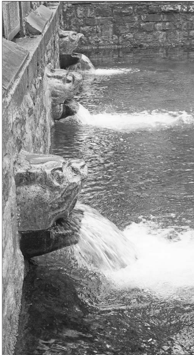
位于济南解放阁南护城河南岸的黑虎泉。

翟军表示,今年1月16日,国家文物局委托中国古迹遗址保护协会组织召开了专家咨询会。“与会专家一致认为,济南泉·城文化景观项目遗产定位清晰,价值突出,链条完整,研究分析充分,全面地反映了济南古城的冷泉利用系统的独特性和代表性,符合遗产要素的真实性和完整性,应加快推进保护管理审批进程。”