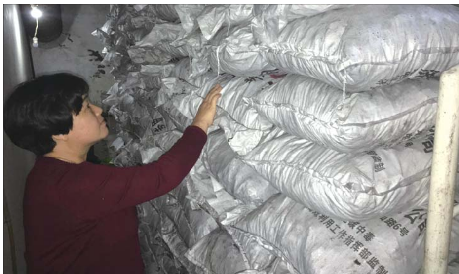
推广清洁煤,有效治理散煤污染。

本报济宁9月10日讯(见习记者 王博文) 济宁高新区实施“气代煤、电代煤”工程区域以外的居民生活用煤清洁化代替,年内辖区计划推广清洁煤1.1万吨,实现高新区民用散煤污染得到有效治理。