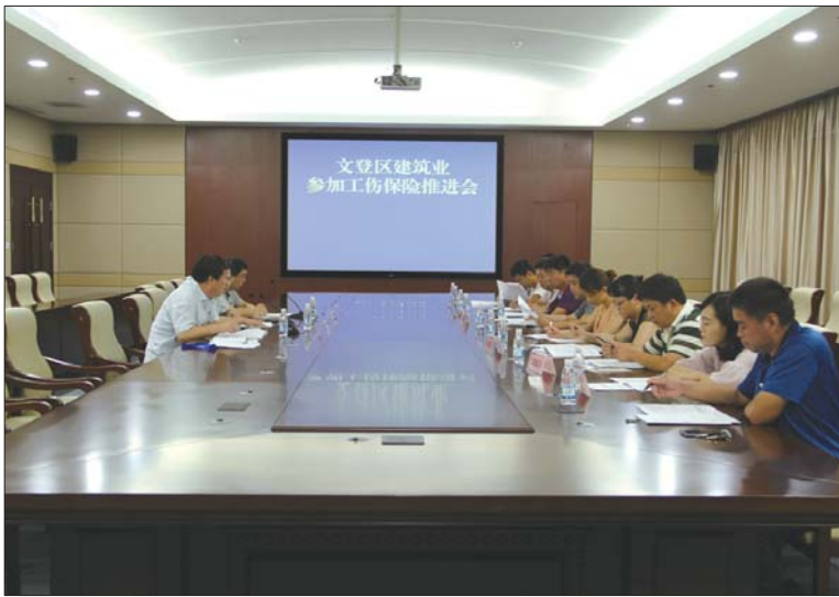
工伤保险工作推进会活动现场。

保险经办机构依法出具工伤保险参保证明。对于已开工在建项目,建筑施工总承包单位已按用人单位单独参加工伤保险的,继续按原方式参加工伤保险,直至工程结束;未单独参加工伤保险的,按剩余的工程总造价的2%计算缴纳工伤保险费,剩余项目工程总造价由住房城乡建设主管部门审核确定。对认定为工伤的建筑业职工,各级社会保险经办机构和用人单位应该依法按时足额支付各项工伤保险待遇。建筑施工总承包单位按建设项目参加工伤保险后,须在工地显著位置予以公示,并告知农民工发生工伤后的保障权益及投诉、举报渠道。