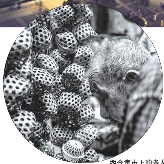
西仓集市上的老人