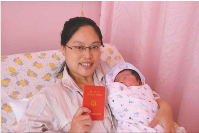
市民为宝宝办理了新生儿落地参保。

本报文登9月19日讯(记者 姜坤 通讯员 王文静) 刚刚出生的孩子就可以参加居民医疗保险。对文登的吴先生来说,这个常识知道的有点晚了。 原来,吴先生的孩子出生时有黄疸,在医院多呆了几天,花了一万多元的医疗费。但吴先生根本不知道有新生儿落地参保的政策,在宝宝出生30天内,没有及时给孩子参加城乡居民基本医疗保险,所以这些费用一分也没能报销。虽然在知道政策后及时参加了居民基本医疗保险,还是错过了最需要的时候。