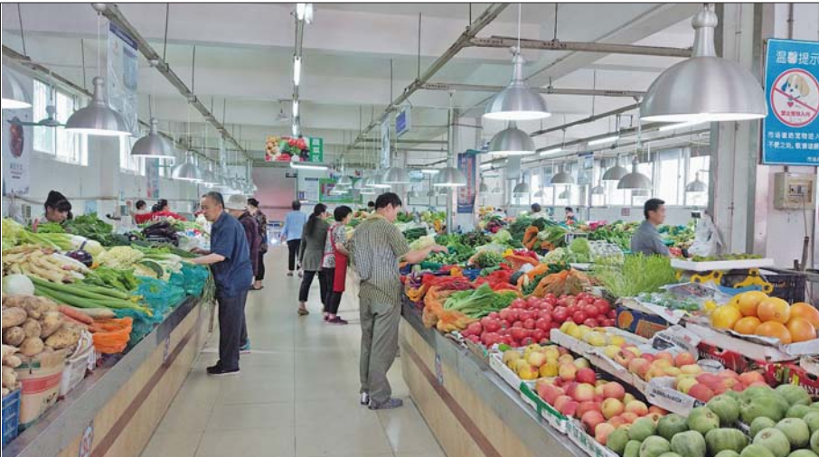
千佛山东路菜市场里,市民正在选购蔬菜。在没有正规菜市场的社区,直通车开入后,居民在家门口就能买菜了。