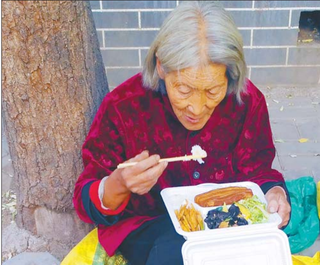
吃到热乎乎的午饭,“扁担奶奶”眼睛有点湿润。

“孩子,不用,我带了干粮了,还有昨天有人给我送来的吃的。”“扁担奶奶”不忍心再麻烦大家。 漱玉平民大药房的工作人员还为老人购买了香蕉等水果。“老人家不容易,以后有什么需要可以来附近的连锁店找我们,进来喝点热水,歇歇脚,我们都欢迎。” 与爱心午餐一起的,还有漱玉平民大药房专门为“扁担奶奶”的儿子准备的健脑药,同时还给了“扁担奶奶”一张便民服务卡,上面还标注了店内的联系电话,“奶奶,只要有需求,随时可以找我们。” “好久没吃这么热乎的饭了。”“扁担奶奶”闻着香喷喷的米饭,看着饭盒里的肉与菜,眼睛有点湿润。“以前每天都吃家里带来的馒头,喝点白开水,热乎乎的饭想都不敢想。” 漱玉平民大药房相关负责人承诺,“只要扁担奶奶进城来卖菜,我们就会保证她能吃到热乎乎的午饭。”