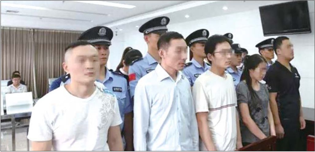
庭审现场。

悬挂条幅、搬运课桌椅、围堵警车,煽动学生家长拒送孩子……历城区教育局安排孩子到他校借读,却引来借读学校部分家长强制阻挠。9月19日,历城区人民法院宣判了这一起聚众扰乱社会秩序案。