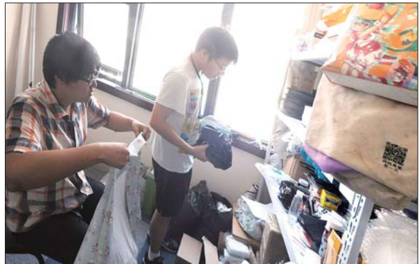
这是存放动漫周边产品的仓库,用来网上销售。