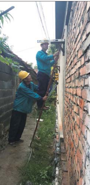
燃气公司工作人员正在为入户管线安支架。

“以前做饭用液化气罐,冬天取暖用煤炉,煤烟把家里的墙壁都熏黑了。”近日,张店区中埠镇边辛村王洪花厨房内安上了天然气管道和壁挂炉,“现在享受70%的政府补贴政策,花了1200元就安上了。”王洪花说。淄博将利用3年时间在市区集中供暖范围以外的区域全面实施冬季清洁供暖气代煤、电代煤工程。