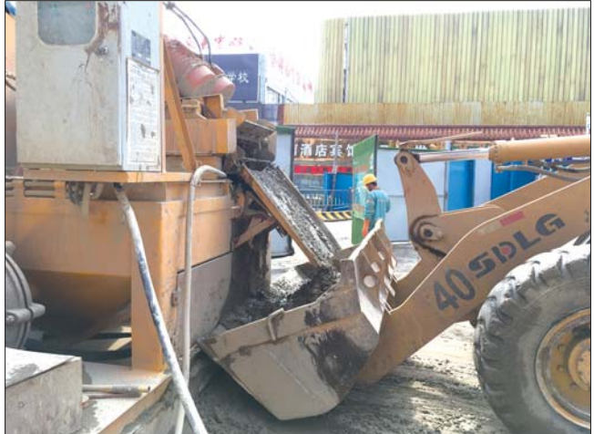
双轮铣槽机把硬石磨成泥后,通过管道吸出。这台泥沙分离器能分离吸出的泥渣和泥浆,泥渣“吐”到挖掘机斗上,泥浆能自动回流重复利用。