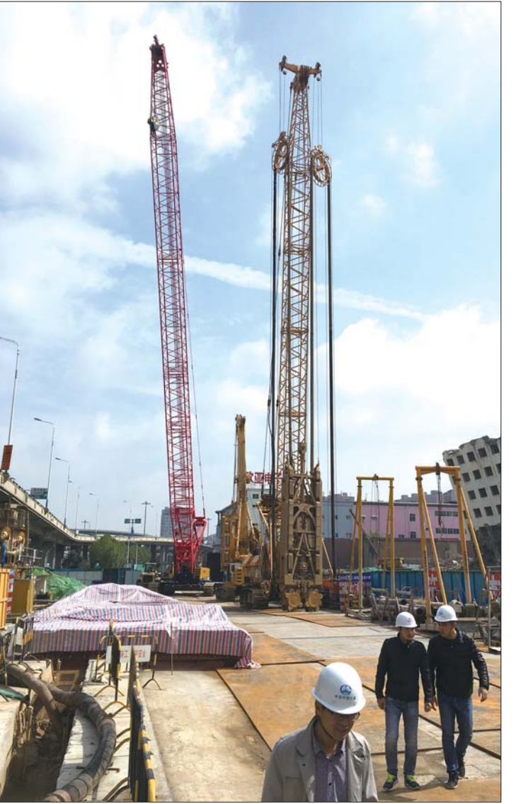
济南地铁施工用上双轮铣槽机,这是位于生产路站的德国进口的神器。