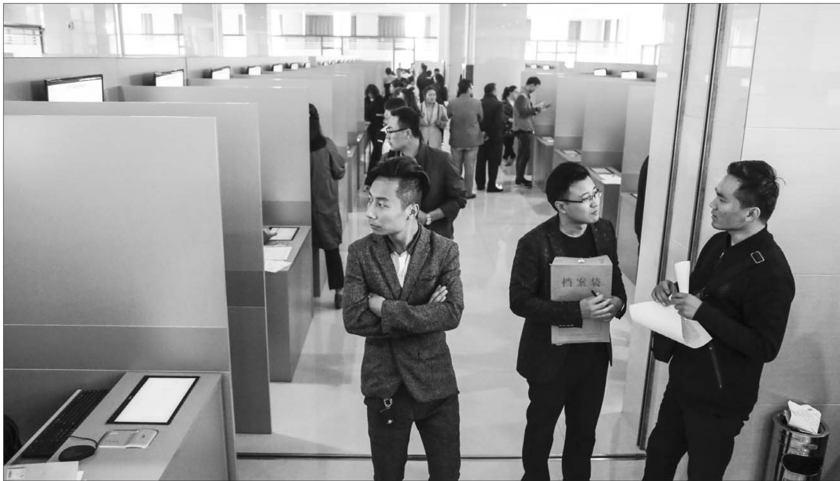
招聘会上,企业对技工需求很大。