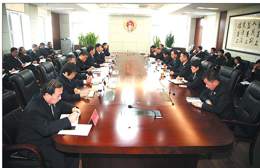
长清检察院召开维稳工作会议。