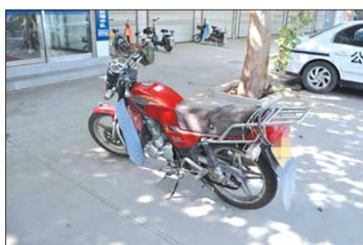
肇事的摩托车

专案组根据现场遗留的碎片和刹车印初步判定肇事车辆为二轮摩托车,并通过附近监控视频发现,车祸发生后,一男子推着摩托车沿文昌路由南向北行进,行至文昌路与龙泉街路口处,该男子将车停在路边,疑似蹲下修车,随后又骑上摩托车快速向北行驶。经反复辨认,该车系红色豪爵牌“银豹”摩托车,有重大作案嫌疑。专案组通过视频监控沿