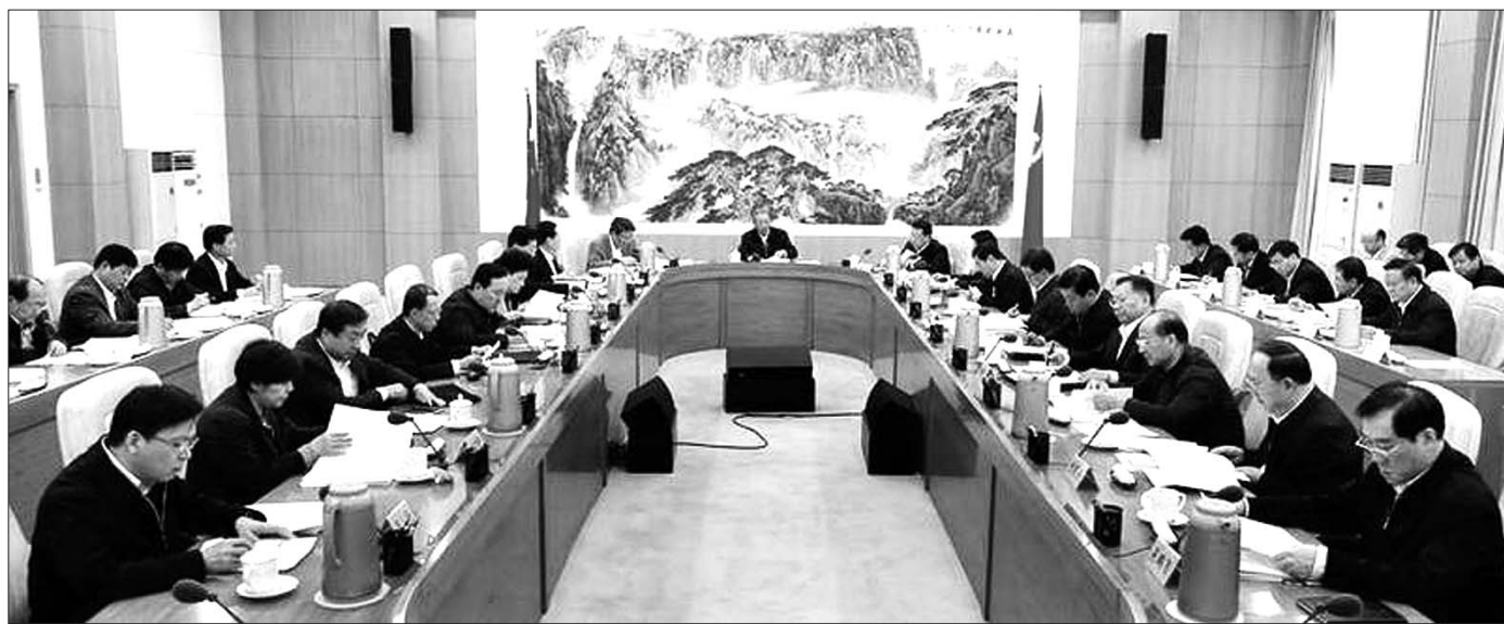
省常委会10月29日下午举行会议,传达学习习近平总书记在军队领导干部会议、十九届中共中央政治局会议和第一次集体学习时的重要讲话精神。

本报讯 省常委会10月29日下午举行会议,传达学习习近平总书记在军队领导干部会议、十九届中共中央政治局会议和第一次集体学习时的重要讲话精神,深入学习领会习近平新时代中国特色社会主义思想,进一步统一思想、提高认识,落实好习近平总书记提出的学懂弄通做实的要求,推动党的十九大精神在山东落地见效。