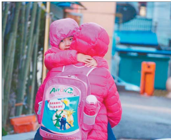
29日气温骤降,不少居民出门穿上羽绒服。

本报济南10月29日讯(记者 高寒 孟燕)“28日中午穿长袖T恤出门,走路多了还出汗。29日早晨出门,穿着薄羽绒服还冻得打哆嗦,真是一夜入冬的节奏。”刚刚过去的这个周末,受冷空气影响,全省居民体验了一把断崖式降温的“酸爽”。济南最高气温从28日的24.9℃一下子降到了12℃,让不少市民吃不消。山东省气象台预报,30日早上,山东内陆地区最低气温仅为1℃~3℃,并会出现霜冻天气。沿海地区最低气温也仅有5℃~7℃。而最高气温,全省普遍在15℃左右。