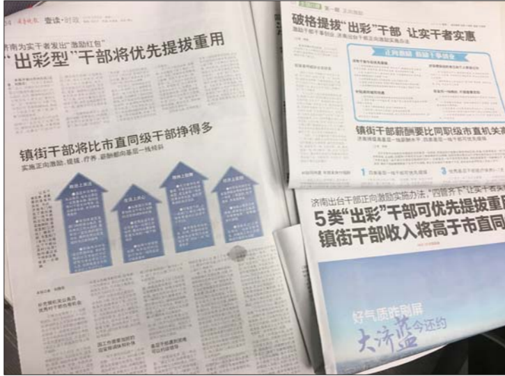
10月29日，济南出台正向激励机制引起强烈社会反响。

“以前我们基层有时会有一种‘春风不度玉门关’的感觉，这一次真的觉得春风拂面了。”天桥区制锦市街道办事处主任姜辉祥说，“基层的工作繁杂琐碎，很小的工作会付出很多劳动，但是这些劳动往往是看不见的。”在姜辉祥看来，这次济南出台的正向激励机制非常全面，从政治上、生活上、精神上和经济上全面正向激励，“我们工作起来也更有动力了。”