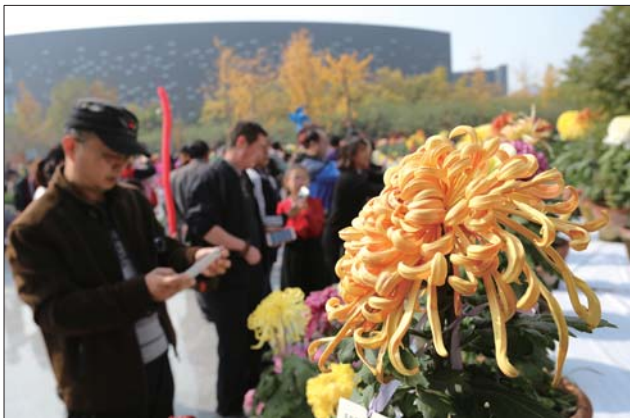
各类菊花盛放待客。