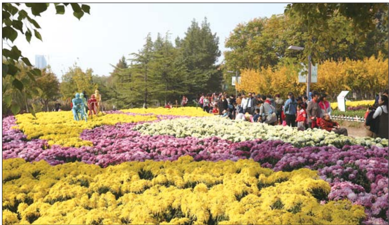
菊花展吸引不少游人前来观赏。