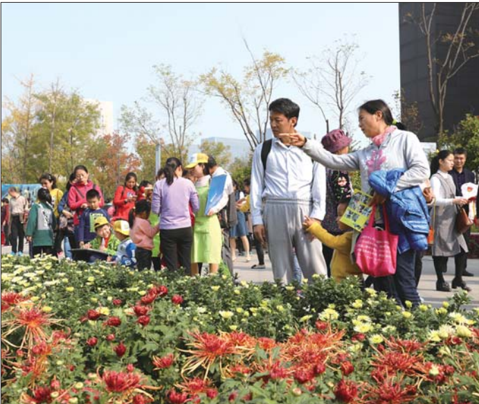
带孩子来游玩的人络绎不绝。