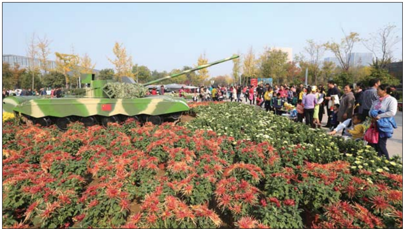
菊花展上的坦克造型引人驻足。