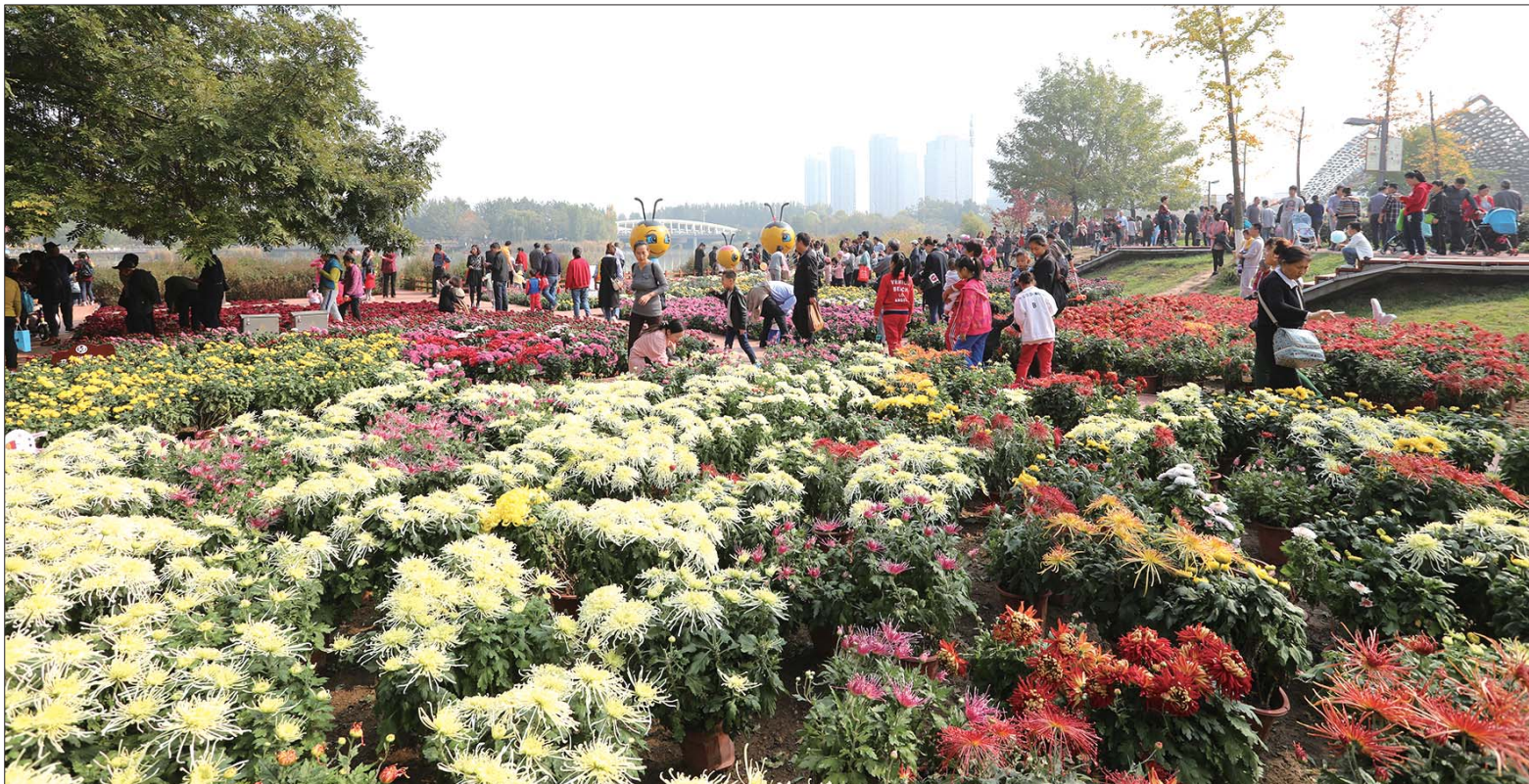
菊花种类、色彩繁多。