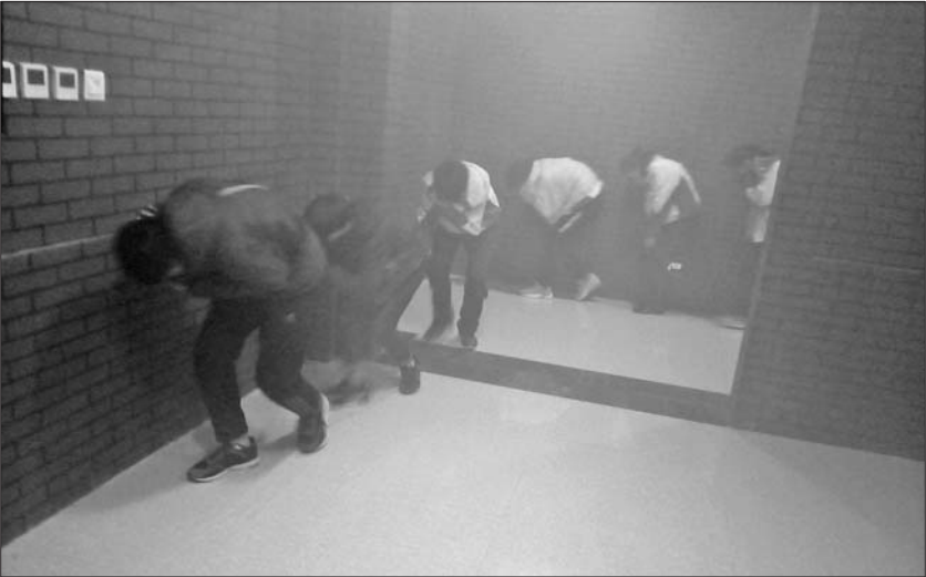
在潍坊市实验学校,学生在浓烟中体验火场逃生。