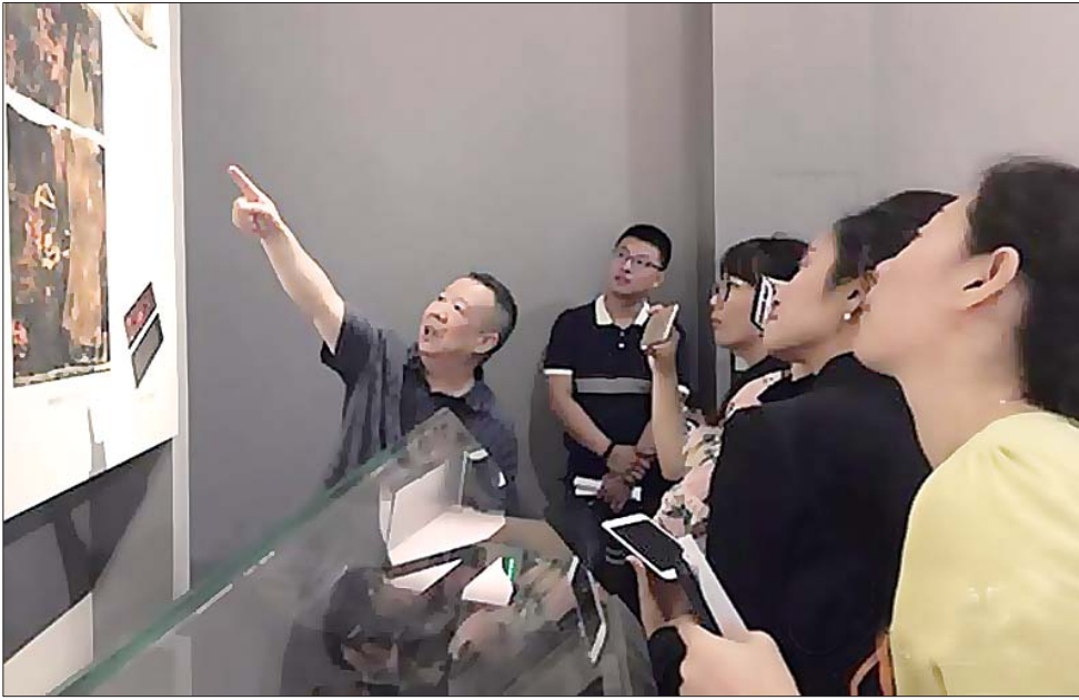
专家在现场为观众讲解。

刘绍刚称,简帛中不仅有美食大全,对古代宴饮也有详细记载,清华所藏战国简中的《耆夜》就记载了周武王宴请宾客的场景,为研究古代宴饮文化提供了丰富的资料。“周武王讨伐黎国大获全胜后,大摆筵席。筵席上出现了周公、召公、毕公、姜齐太公等重要历史人物。大家互相敬酒时,武王赋诗《乐乐旨酒》,这个场景全部被记载下来。”《乐乐旨酒》的部分内容用大白话翻译过来就是