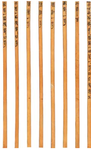
马王堆汉墓遣册食品简(局部)

墓主人陪葬了多少双袜子、鞋子、枕头、裙子、袍子等衣物。在山东出土的汉墓中,女性墓中陪葬的梳子、篦子数量非常多,说明这是风俗。而墓主级别地位高的墓中,还有琴、瑟等物品。遣册记录内容特别详细、全面,可以窥见古人衣冠鞋帽的方方面面,有趣又生动。