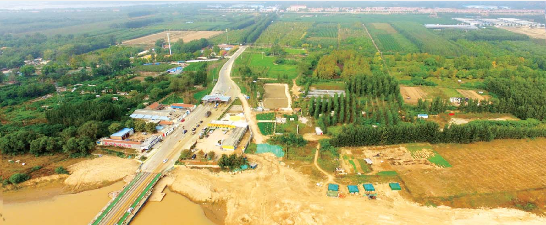
从冻口浮桥俯瞰河北岸,大片基础设施有待投资开发。