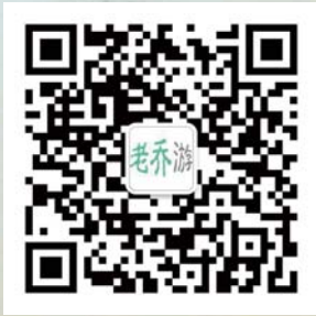
扫描二维码了解更多资讯