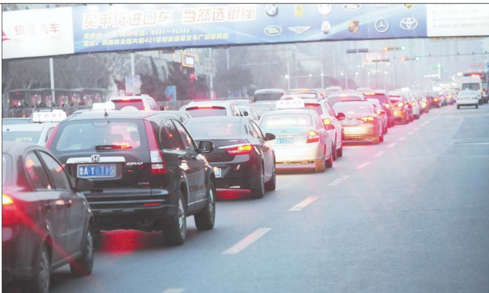
缓解拥堵,公交车道将允许右转车辆借道。(资料片)

为配合公交专用道调整,交警部门也将对公交专用道标识、标线进行优化更新,设置限时公交专用道标识和限时地面标识,同时优化公交专用道抓拍设备抓拍时间。