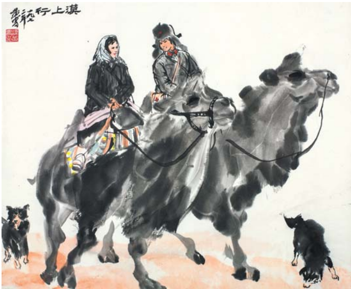
012 黄胄(1925-1997) 漠上行 设色纸本 立轴