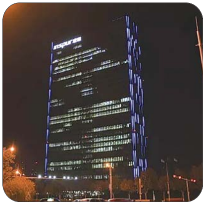
这是22:30的浪潮集团大楼。

从热力图中看到,加班比较集中的区域有济南市高新万达广场、浪潮路、经十路银座中心、市中区银工大厦、环宇城、历下区铭盛大厦、保险大厦等。