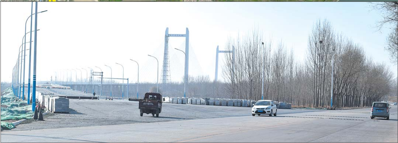
齐河黄河大桥建成后,济齐路西段也将拓宽。

5日上午,记者在济齐路西段看到,道路南侧挖出了一条深约一米,宽约半米的沟槽,施工牌上写着济南“气代煤”工程,自西向东大约有一公里远,