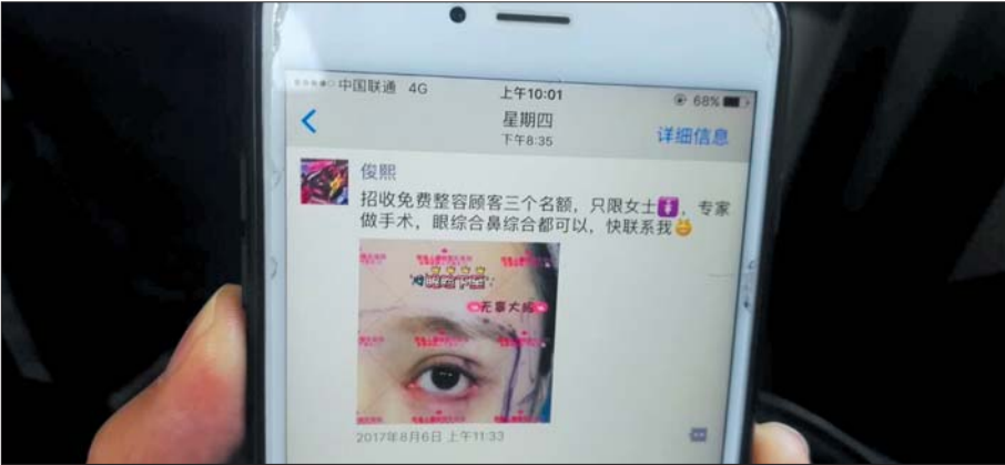
“俊熙院长”发的免费整容信息

洁,本被承诺做免费的美容整形项目,不料却背上高额的贷款,近日,有数十个年轻女孩疑似陷入美容贷骗局。一个自称济南某医疗整形美容院院长的男子曾向这些女孩承诺,如果帮忙做宣传就可以免费做整形,但要走个程序,需要女孩贷款付手术费,目的是为了“拴住”女孩做宣传,每月的还款将由男子转款偿还,相当于免费。然而,今年10月份,男子突然失联,数十名贷款女孩无奈只能自己还款。