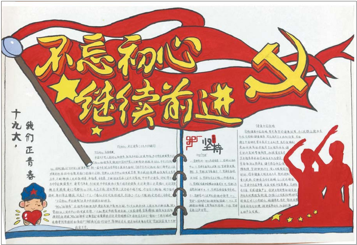
第一名——济宁学院2017级视觉传达设计专升本二班

通过为期一周的网上投票,共有41幅符合要求的作品入选。本着公平、公正的原则,综合了网络投票票数和专业导师给出的评分,最终济宁学院2017级视觉传达设计专升本二班的25号作品《不忘初心 继续前行》一举夺魁,拿下了本次手抄报比赛的最高分。