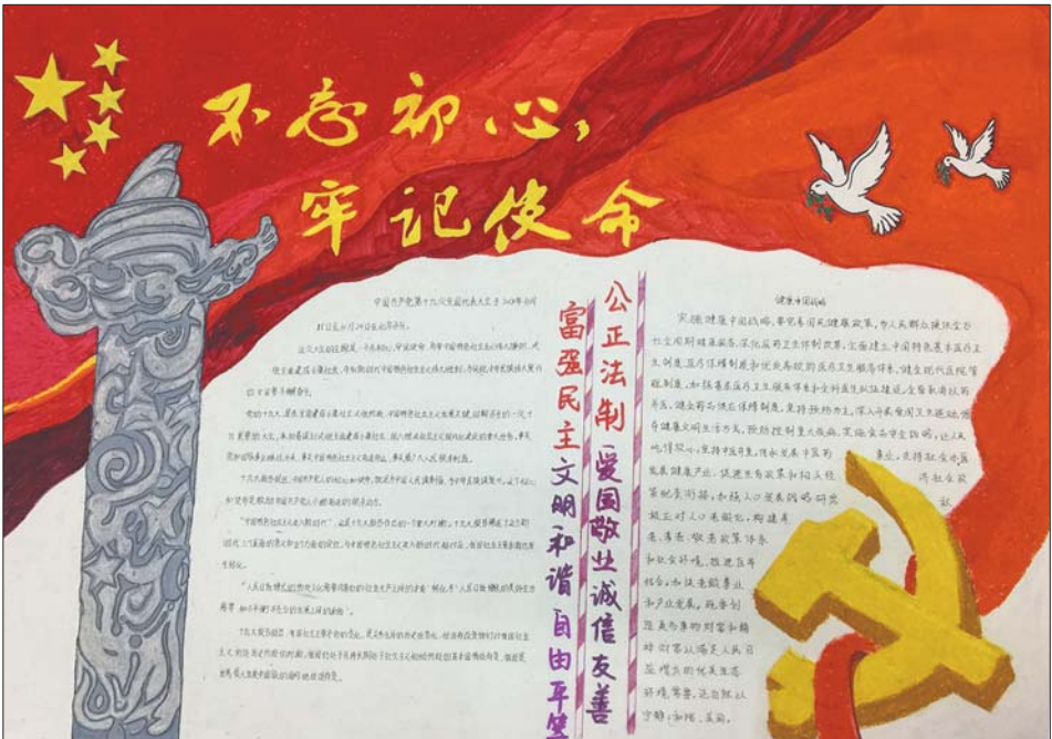
第二名——济宁医学院2015级制药工程