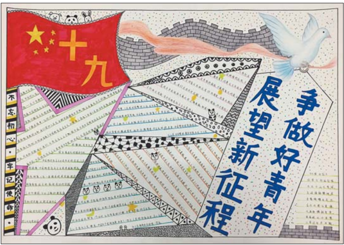
第三名——济宁学院2016级服装与服饰设计