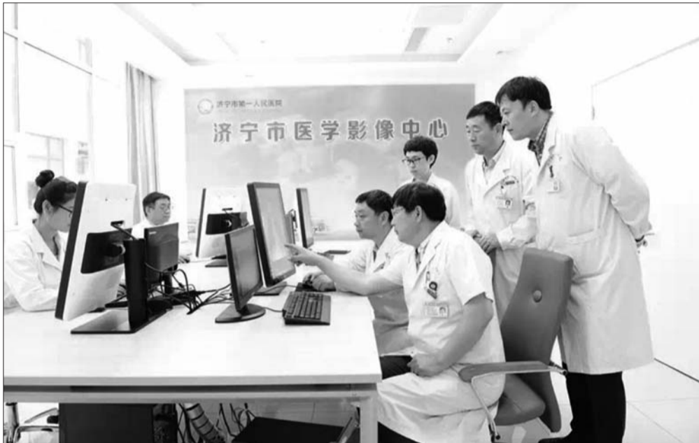
今年完成远程会诊20.1万例,给百姓带来实在福利(资料图)。