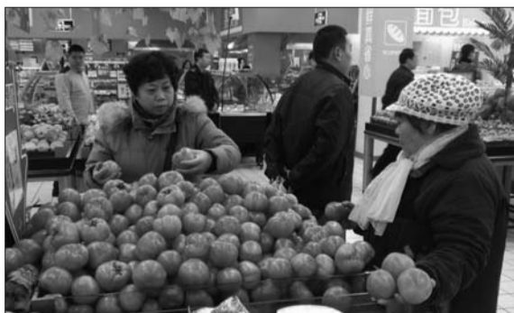
市民在超市购买蔬菜。本报记者 李锡巍 摄

当日上午,督查组“兵分两路”前往济宁市任城区和邹城市的农产品养殖、屠宰、食品生产、流通和餐饮等各个环节企业进行督导检查。在唐口工业园三强乳业新厂区,检查人员参观了企业的全自动灌装线、质检区等,并依据食品生产企业督查工作清单,对企业开展成品出厂检查、食品安全追溯体系建设和实施等情况进行了详细了解和检查。在任城区神道路的沃尔玛超