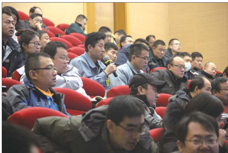
培训现场,企业代表咨询相关问题。

重预防机制建设的负责人员熟悉了平台系统的建设,了解了系统录入过程中的注意事项以及双重预防机制验收执法标准,为企业进一步深化双重预防机制和平台建设