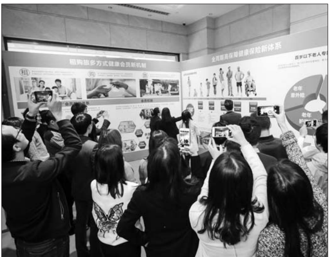
12月14日,恒大健康旗下拳头产品“恒大养生谷”在广州正式亮相。

自去年对外宣布“优化医疗服务、完善健康保障、发展大健康产业”三大发展战略后,恒大健康集团的业务发展就进入了快速发展期。12月14日,恒大健康旗下拳头产品“恒大养生谷”在广州正式亮相。