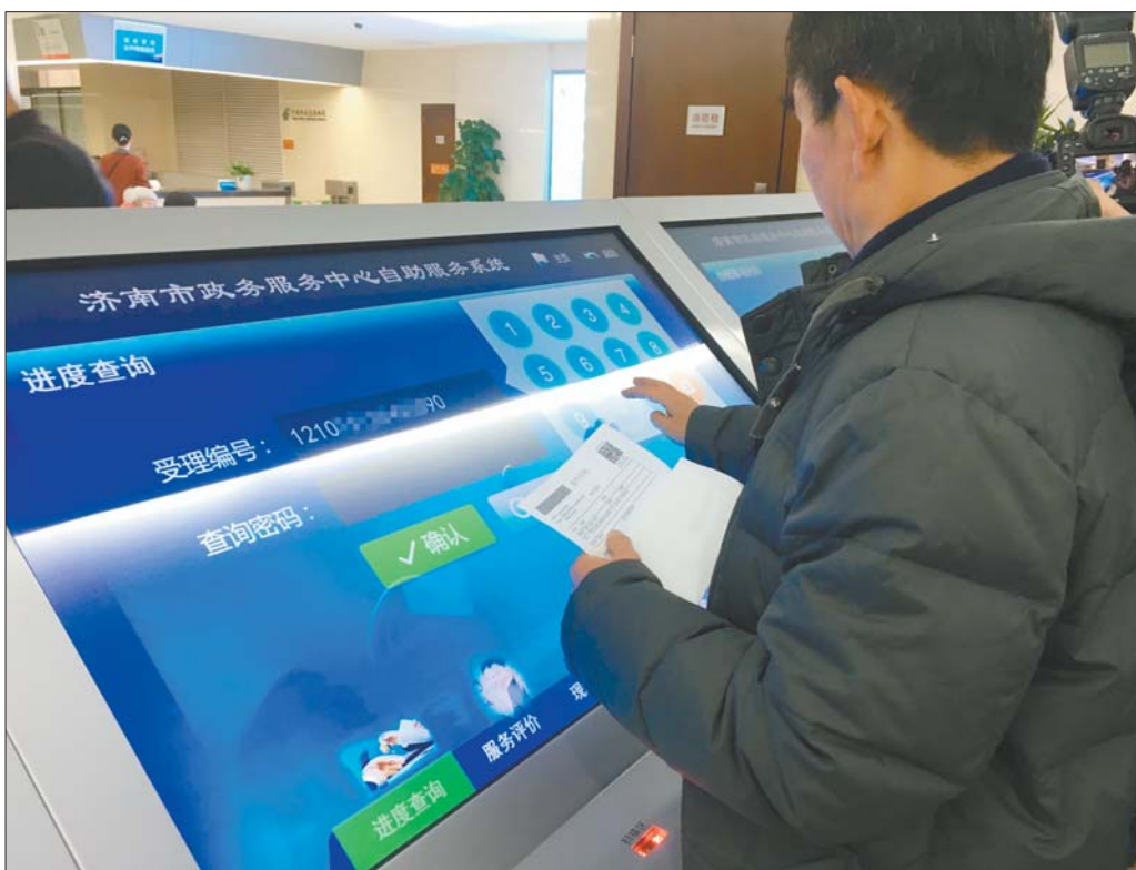
一名济南市民正在使用济南市政务服务中心自助系统办理业务。

理”、联审联办、全链条办理等行政审批新模式,减少政府对微观经济的干预,最大限度地向市场放权,营造诚信、公平、法治的市场环境和生机勃勃的“双创”生态环境,让企业安心经营、潜心创业、放心发展。