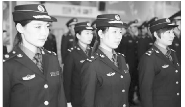
任城区综合执法队员换上新装。

此次统一亮相的新制服,男士为大檐帽,女士为卷檐帽,服装颜色为藏青色及天空蓝色,搭配金色标识,色彩鲜明。标志标识设计方采用国徽、人字飘带、盾牌、牡丹花、橄榄枝等元素。制式服装及标志标识文字统一使用“城市管理执法”字样。