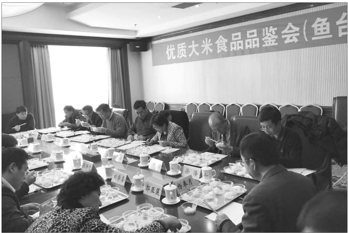
17位专家现场品鉴国内外12种稻米品种。

鱼台县为对稻米产业提档升级,于2017年制定了《鱼台县绿色稻米产业发展规划》,以提高稻米食味为重点,开展水稻品质提升工程。采取“合作社龙头企业基地”的生