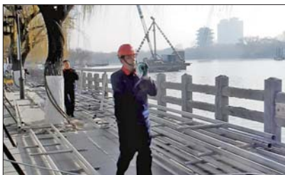
20日，安装在底座上面的喷泉部分设备正运抵岸边，不久将开始安装。

轨道底部有钢柱固定，支撑起大船重量。为方便湖内施工，大明湖已降低40厘米水位，后期施工完成后，轨道将在水下。同方股份有限公司负责人表示，这艘专为“明湖秀”打造的大型表演船完成一半施工。“下水”后，工人将继续组装船上古建。该仿古大船将是“明湖秀”中移动的表演载体，高3层。白天，它停靠在湖岸，是一艘和周边古建、湖水融为一体的仿古船；到了晚上，船的门、窗一翻转，整个船身就会变成异形的LED表演屏，变身“明湖秀”的一个重要表演主体。