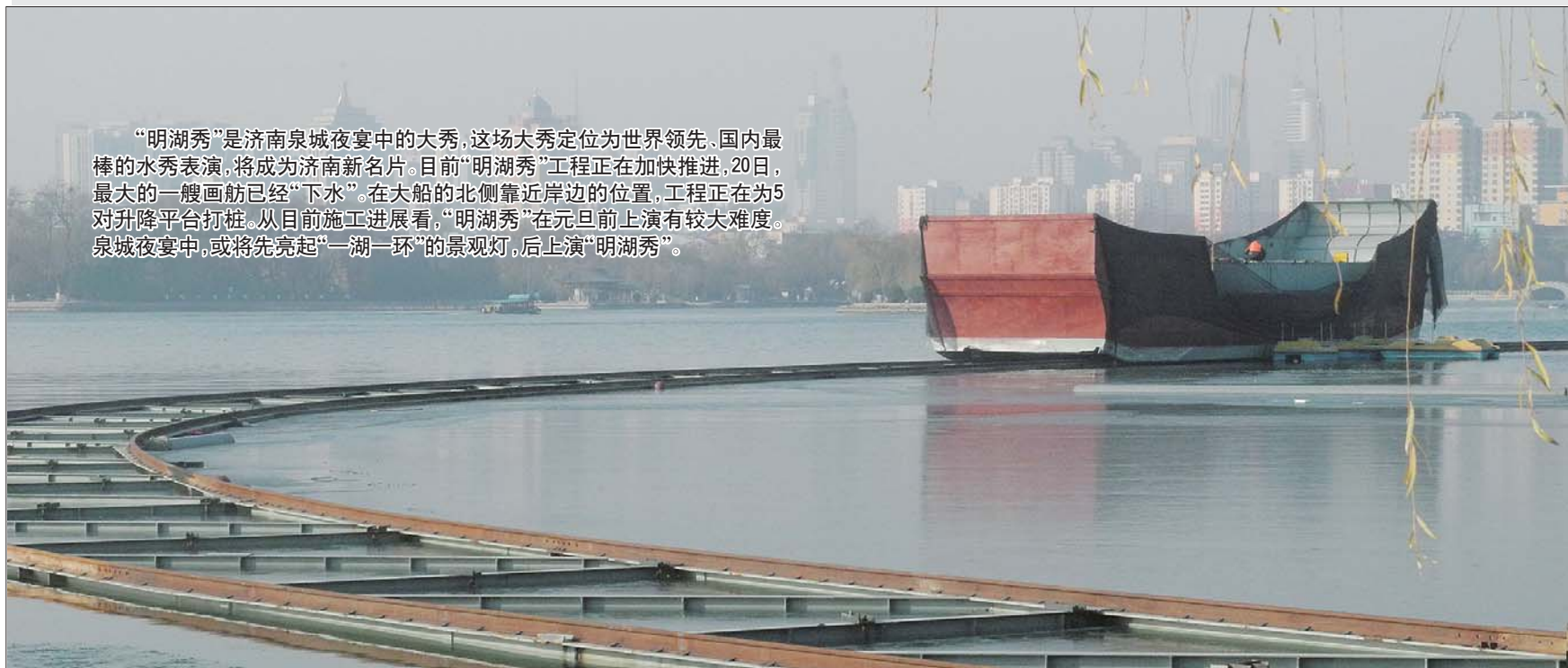
20日，大明湖景区“明湖秀”工程有序进行。原来一直在岸上建造的大船“开”上了湖中的轨道。

“明湖秀”是济南泉城夜宴中的大秀，这场大秀定位为世界领先、国内最棒的水秀表演，将成为济南新名片。目前“明湖秀”工程正在加快推进，20日，最大的一艘画舫已经“下水”。在大船的北侧靠近岸边的位置，工程正在为5对升降平台打桩。从目前施工进度看，“明湖秀”在元旦前上演有较大难度。泉城夜宴中，或将先亮起“一湖一环”的景观灯，后上演“明湖秀”。